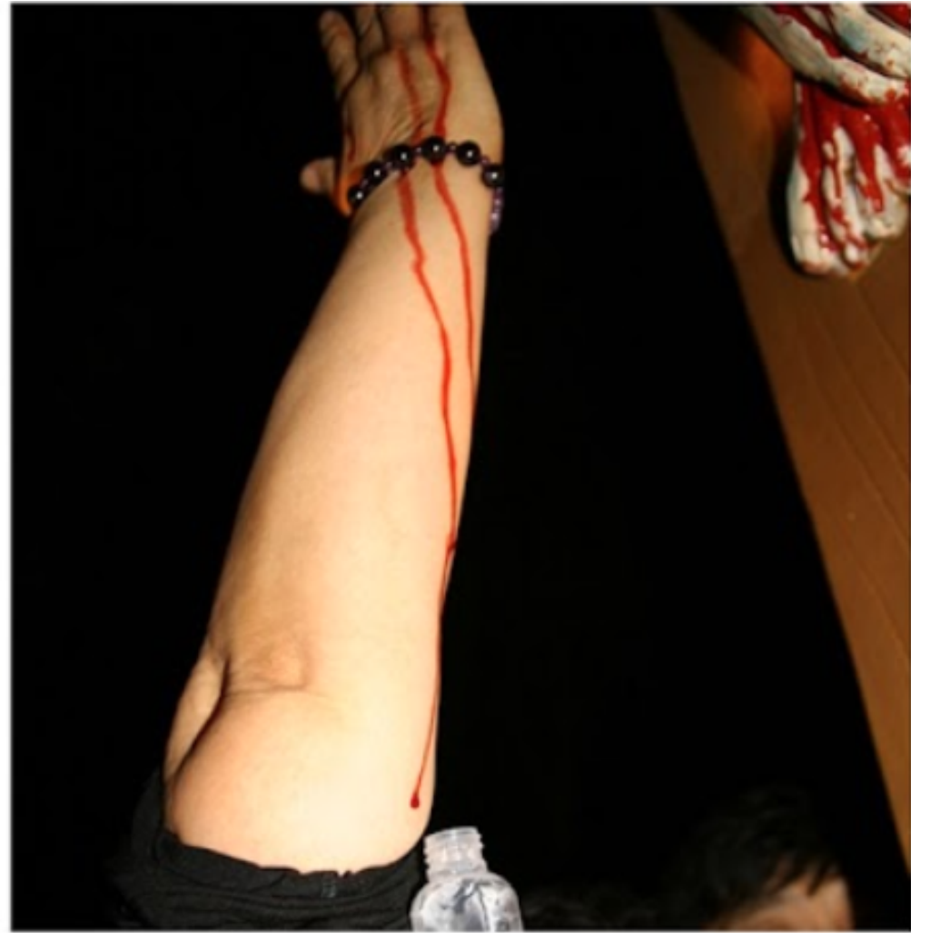
When Julia touched the foot of Jesus, the Precious Blood came out of it and flowed down her hand and arm, surprising the people present.